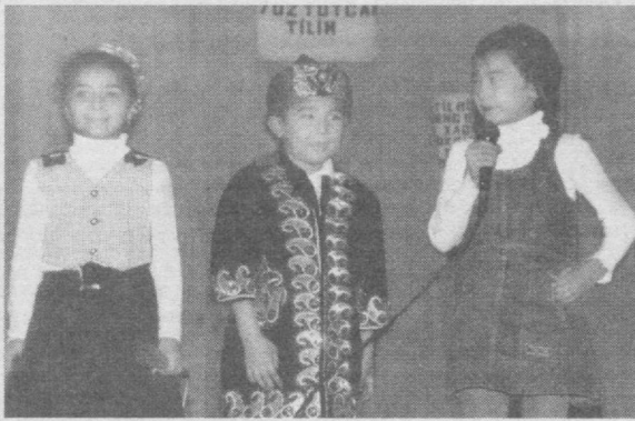
Тил миллатнинг фахри ва гуруридир. Ҳар бир миллат ва элат ўз тили, дини, миллий урф-одатлари билан гўзалдир. Қувонарли томони шундаки, шахримизнинг барча ўқув масканларида «Давлат тили ҳақида»ги қонун қабул қилинган кун муносабати билан қизиқарли адабий-бадий кечалар бўлиб ўтди.