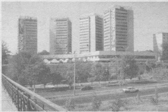
Замонавий ва кўркам бинолар шахримиз қиёфасига янада чирой бағишламоқда