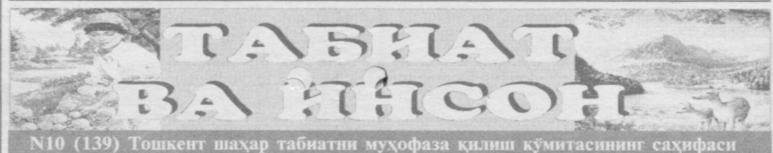
№10 (139) Тошкент шаҳар табиатни муҳофаза қилиш қўмитасининг саҳифаси

Бу ойнинг гўзал фазилатларидан яна бири шуки, бу даврда қузғи қўчат ўтказиш қизгин паллага киреди. Шаҳримиз хиёбон ва боғлари, катта йўл чеккалари экилган ва нихоллар борада яшил барг чиқариб, гўзал Тошкентимиз хуснига хусн қўшади.