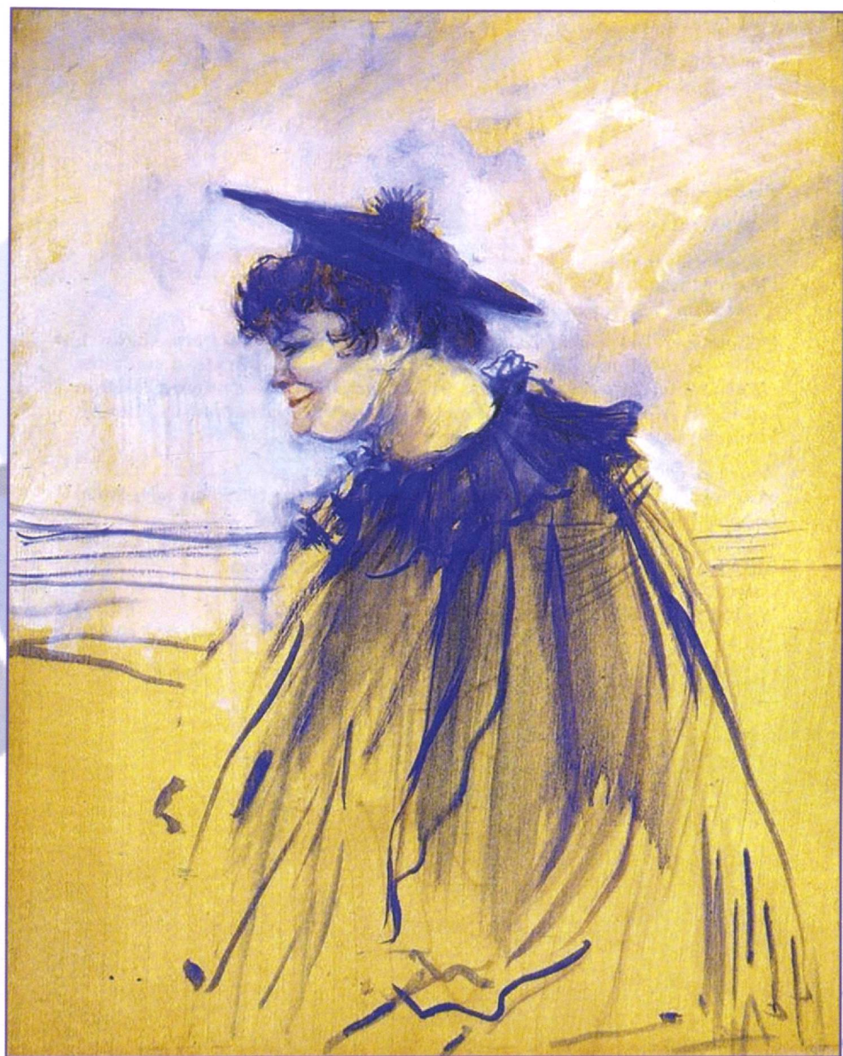
Anri de Tuluz-Lotrek. "Ingliz xonandasi (Dolli xonim) "