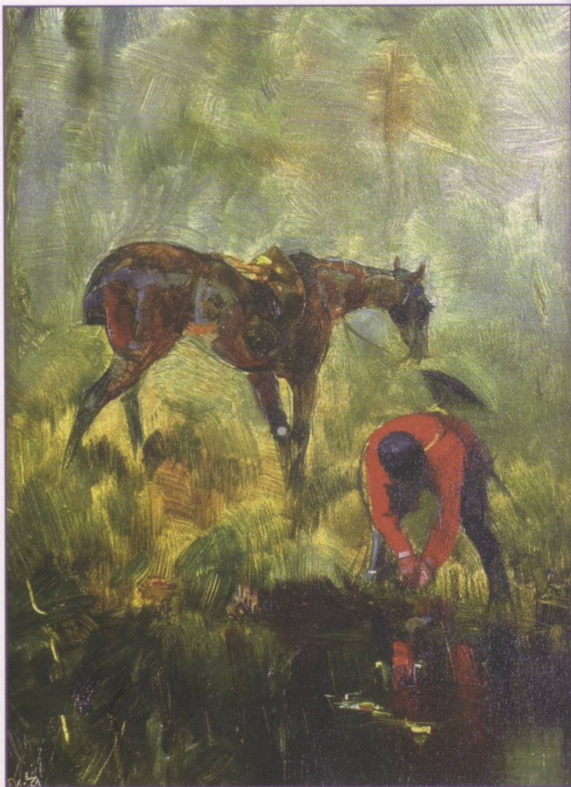
Anri de Tuluz-Lotrek. “Ot bilan sayr”