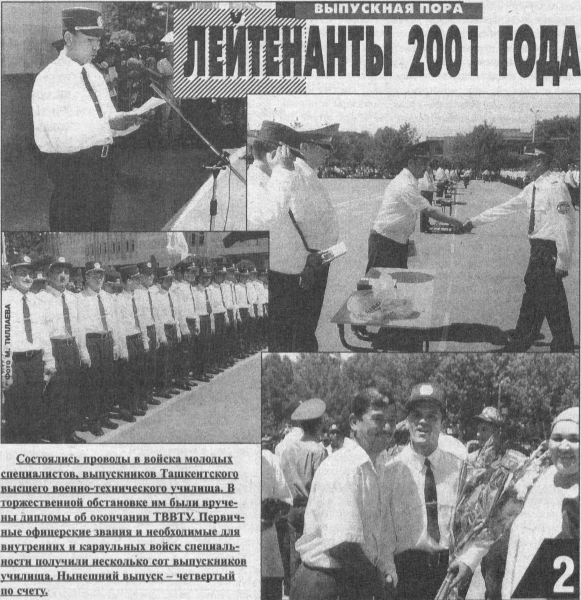
Состоялись проводы в войска молодых специалистов, выпускников Ташкентского высшего военно-технического училища. В торжественной обстановке им были вручены дипломы об окончании ТВВТУ. Первичные офицерские звания и необходимые для внутренних и караульных войск специальности получили несколько сот выпускников училища. Нынешний выпуск – четвертый по счету.

Конечно, не следует думать, что с наркобизнесом и наркоманией можно покончить в одночасье. Это общечеловеческое бедствие пустило на нашей планете такие глубокие корни, что их выкорчевать можно только объединенными усилиями всех субъектов международных отношений, всего мирового сообщества. Несомненно, весомую лепту в это общечеловеческое дело внесет и деятельность Шанхайской организации сотрудничества, полноправным членом которой является и независимый Узбекистан. Ведь не случайно то, что главной задачей этой организации является борьба с международным терроризмом и региональным экстремизмом, базирующимся на наркоторговле. Реализация этих задач, несомненно, выведет борьбу с общечеловеческим злом – наркоманией – на новый уровень.