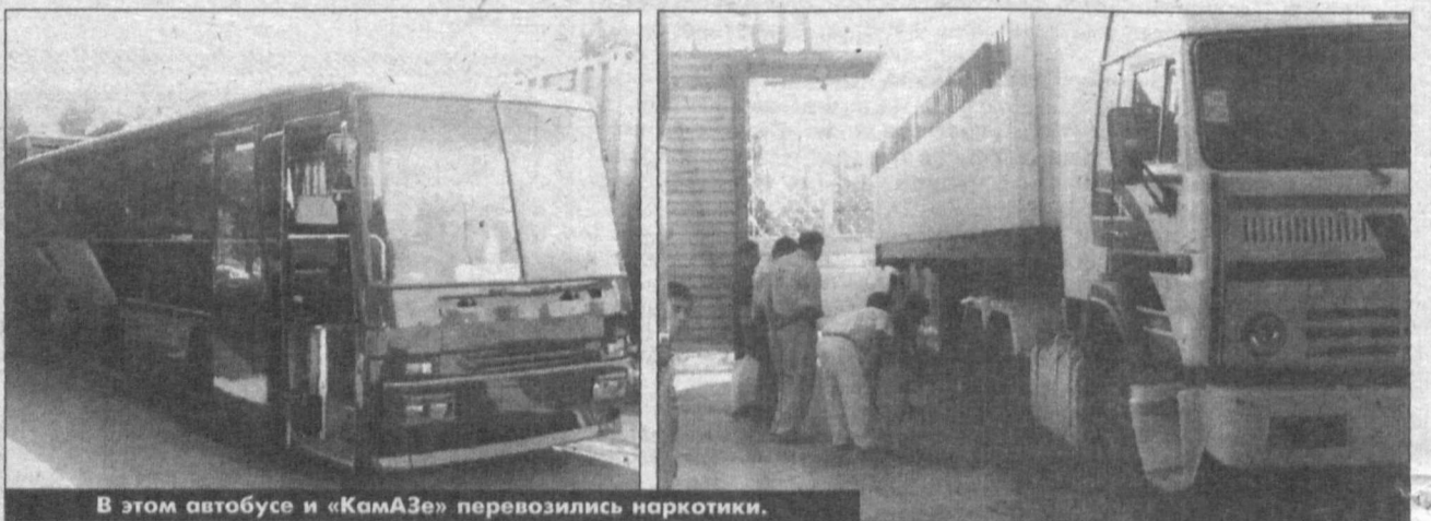
В этом автобусе и «КамАЗе» перевозились наркотики.