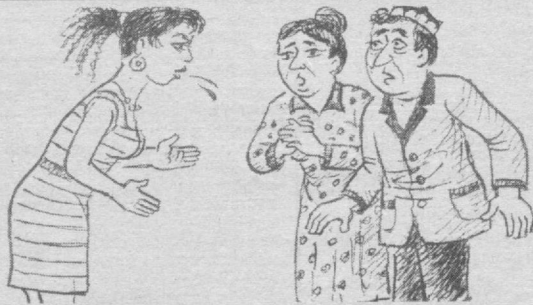
— Камбағал кўёвга турмушга чиқмайман. Абдурауф Ҳақимов чизган расм.

● Ўзбек Миллий академик драма театрида Э.Хушвақтов асари «Қаллик ўйини» спектакли соат 13.00 да бошланади.