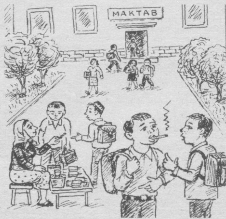
Изоҳга ҳожат йўқ.

Бу маҳсулот юз терисини яхшилайди. Янги қаймоқ юзга кўркамлик бахш этади, танадаги чарчоқни олади. Ярим стакан суюқроқ қаймоққа 1 чой қошиқ лимон суви қўшиб аралаштирилади, сўнгра пахта билан яхшилаб бетга суртилади. Кўзга суртмаслик керак. Лимон суви кўзини ачиштириши мумкин. Кўзга суртиш учун фақат қаймоқнинг ўзидан фойдаланиш мумкин. 20-30 дақиқадан сўнг юзингизни илиқ сув билан чайиб ташлайсиз.