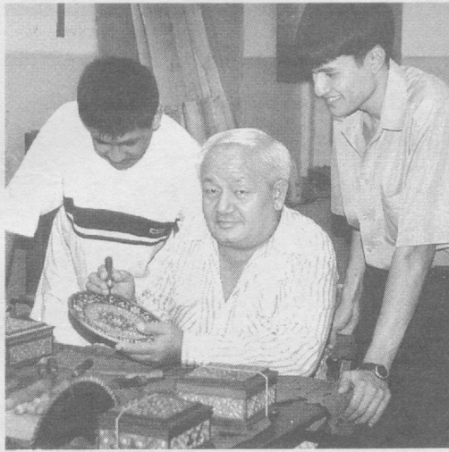
Халқ хунармандчилиги анъаналари барҳаёт.

Австралиядаги маҳсус сув ҳавзаларида яшайдиган Флаббер лабэли дельфиннинг вазни 160 килограммдан ортиқ бўлиб қикди. Ҳа, нима бўлибди дерсиз: узунлиги икки ярим метрдан ошадиган бу «балиқча» дельфинларнинг энг тўласи экан. Уни кўрганлар кўпинча денгиз сигирига ўхшатишадди. Нима учун Флаббернинг вазни бошқа дельфинлардан ортиқ? Ҳар хил қолди-қутти овқат, мева-сабзавот деганидек, «балиқча»нинг кундалик таомномаси фақатгина ана шулардан иборат.