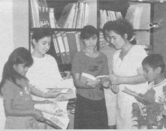
«Тошкент оқшоми»га жавоб берадилар

аёвсиз танқид қилади, муаммони бар-тафат этиш ҳақида ўз фикрларини очиб-ойдин билдиради. Хулоса қиладиган бўлсак, «Тошкент оқшоми» газетасининг ижодий ходимлари сизларнинг мактубларингиз ва кўнгирикларингизни интиқлик билан кутади.