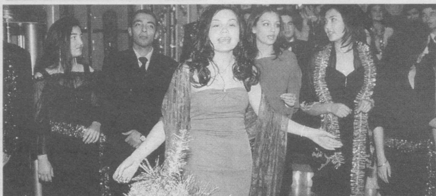
Юртимизда байрам шодиёналари кўтаринки руҳда бошланди.

ришларини тайёрлашда унга тахлий жихатдан ёндошишлари лозим. Радиожурналистлар семинар-тренингда Ўзбекистон иқтисодиёти ривожининг асосий йўналишлари, банк иши, солиқ тўлови ва ижтимоий масалалар, Ўзбекистонда халқаро инвесторларнинг иш тажрибаси, иқтисодий мавзуда радио эшиттиришлар тайёрлаш мавзуларида маърузалар тинглашди. Шунингдек, қатнашчиларга иқтисодий мавзуда радиоэшиттиришлар тайёрлашда ва тингловчиларни унга жалб қилишда нимага эътибор қаратиш лозимлиги хусусида батафсил маълумот берилди.