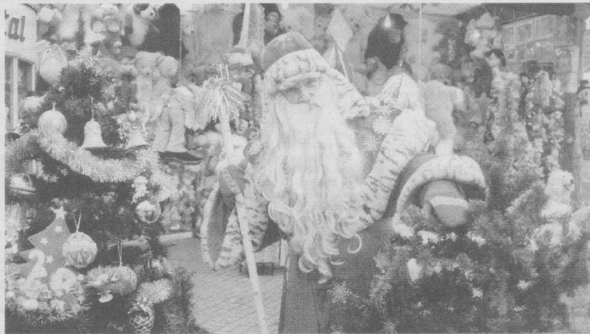
Шаҳримизда байрам тантаналари қизгин давом этмоқда.