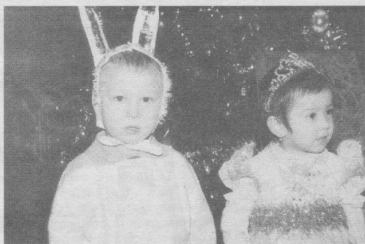
Янги йил шукрати

— Ўтаётган йилдаги энг катта ишларимиздан бири пойтахтимизда бунёд этилаётган Кичик халқа йўли қурилишида фаол иштирок этганимиздир. Ана шу меҳнатларим муносиб баҳоланиб, юксак унвоним қаторига шарафли мукофот — «Шухрат» медали ҳам қўшилди. Бу менинг ҳаётимда ўтаётган йилнинг энг шодибена наъзаларидан бири бўлди. Ниютим эса Янги йилда ҳар биримизни ана шундай қувончлар муваффақиятлар тарк этмасин.