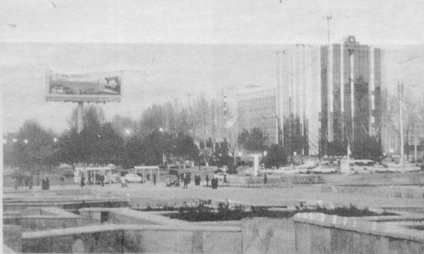
Шаҳримизга оқшом чўкмоқда.

ШХТнинг Марказий Осиё фаровонлиги ва манфаатларига қаратилган эркин мусохаба минбарига айланиши эллик йил-