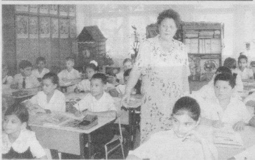
Ёшлар — келажакимиз.

Бу тадбир БМТ Бош ассамблеясининг 57-сессияси 2004 йилни Халқаро гуруч йили деб қилгани муносабати билан ўтказилмоқда. Унинг мавзуси «Гуруч - бу ҳаёт» деб аталган бўлиб, инсониятнинг барқарор ривожланиши учун мазкур қишлоқ хўжалиги маҳсулотининг улкан аҳамиятини тўлиқ акс эттиради.