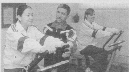
Мирзо Улугбек туманида фаолият бошлаган «Умид» болалар спорт мажмуида ёшларимизнинг соғлиқларини тиклашлари ва спорт билан шуғулланишлари учун мана шундай шарт-шароитлар яратилган.