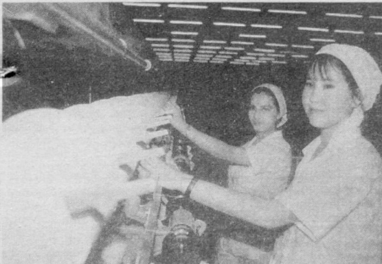
Шахримиздаги «Кобул-Ўзбек» қўшма корхонасида ғайратли, ўз ишига талабчан йигит-қизлар меҳнат қилишди. Уларнинг хорижий линияларда ишлаб чиқараётган юксак сифатли ип-калава маҳсулотлари жаҳон бозорида ўз ўринини топган.

● Ингушетияда гаройиб тўй бўлиб ўтди. Куёв бўлимининг ёши 104 га етган бўлса, турмуш ўртоғи ундан атиги 32 ёш кичикдир.