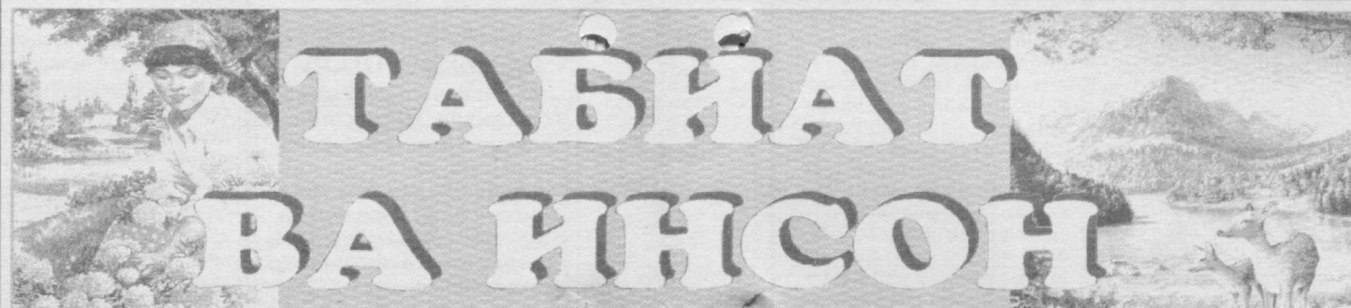
N2 (142) Тошкент шаҳар табиятни муҳофаза қилиш қўмитасининг саҳифаси