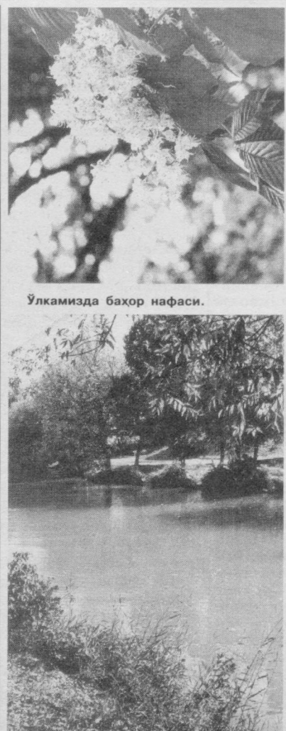
Улкамизда баҳор нафаси.