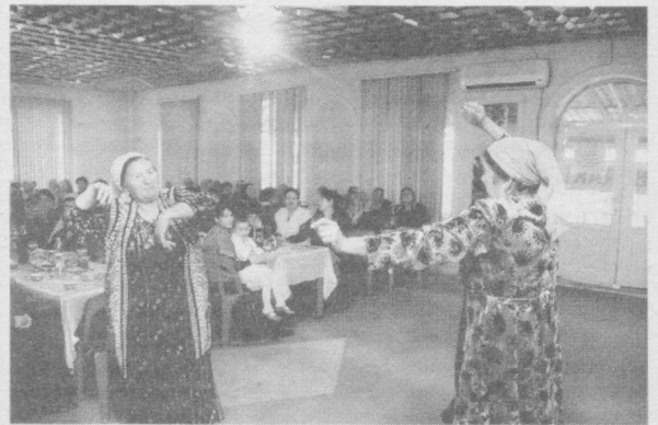
Собир Раҳимов туманидаги «Аҳил» маҳалласида Наврўз айёми муносабати билан байрам тадбири бўлиб ўтди. Маҳалла ахли «Абдужалилхон ота» гузарига йиғилдилар.