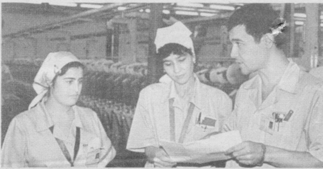
«Kabil-Uzbek Co» Жанубий Корея-Ўзбекистон қўшма корхонасида тўрт минг кишилик жамоа самарали фаолият кўрсатаётган бўлиб, корхона маъмурияти ва касабаси уюшмаси кўмитаси ҳамкорликда ишчи-хизматчиларни ижтимоий муҳофаза қилишга муҳим эътибор қаратмоқда. Жумладан, касабаси уюшмаси кўмитаси маблағлари ҳисобидан бепул тушликлар ва йўл картончалари берилмоқда.

Тошкент шаҳар касабаси уюшмалари Кенгашининг саҳифаси