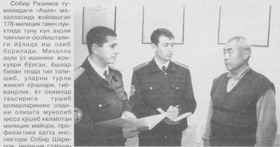
СУРАТДА: навбатдаги иш режалари муҳокама қилинмоқда.

Ҳукуматимиз томонидан қабул қилинаётган қонун ва қарорларнинг моҳиятини тушуниб-тушунмай ёки бида туриб ўз нафсларини қонунлардан устун қўйган айрим ҳамшаҳарларимиз иқтисодий ва жинойи қонунбузарликларга қўл урмоқдалар. Жумладан Ўзбекистон Республикаси Вазирилар Маҳкамасининг 2002 йил 6 майда «Жисмоний шахслар томонидан