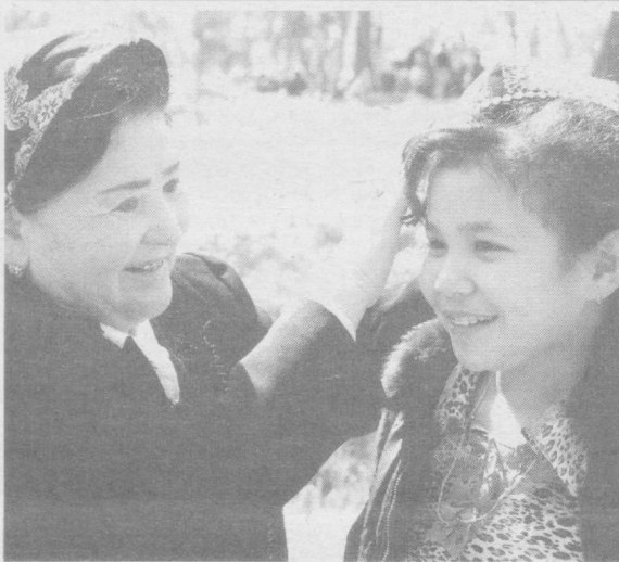
Бахт— иқболнинг баланд бўлсин қизалогим, Гулгун чехранг қулиб турсин овуңчоғим.

Воҳид АХМЕДОВ, Тошкент шаҳар Фавқулодда вазиятлар бошқармаси матбуот хизмати бўлими бошлиғи