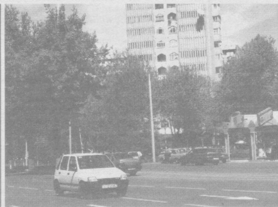
Шахримизнинг равон ва шинам кўчалари.