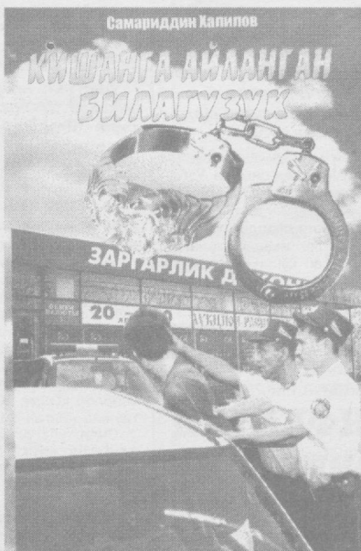
оч бўлиб дунё юзини кўрган бундай китобларнинг яна қўллаб чоп этилишини ва ўқувчилар меҳрини қозонишини тилаб қоламиз.