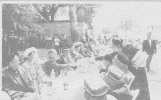
2004 — Меҳр ва мурувват йили