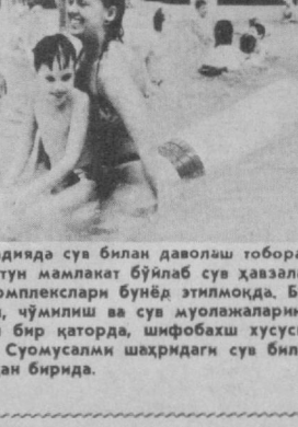
Финляндияда сув билан даволаш тобора оммавийлашиб борапти. Бутун мамлакат бўйлаб сув ҳавзалари, соғломлаштириш сув комплекслари бунёд этилмоқда. Бунки тугунса бўлади. Сабани, чўмилиш ва сув муолажаларининг ўзи ёқилли бўлиш билан бир қаторда, шифобах хусусиятга ҳам эга. СУРАТДА: Сўмсудалии шаҳридаги сув билан даволаш шифоналаридан бирини.

лари даражасида Покистон—Ҳиндистон музокараларининг биринчи бошқичи туғалланди. Бу музокаралар икки қўшни давлатнинг ўзаро муносабатларидagi кескинлигини юмшатиш мақсадига бағишланди. Асосийэйтед пресс ОФ Пакистан ахборот агентлигининг «ишончли манбала»га таяниб хабар қилишича, томонлар икки йўллама муносабатларидagi кўпдан-кўп муаммолар юзасидан фикрлашиб олдилар, бироқ асосий масалалар — Қашмир хусусида, шунингдек ўз қўшинларини Покистон—Ҳиндистон чегарасидан уларнинг доимий турадиган жойларига олиб кетиш тўғрисидаги масалалар юзасидан бирон-бир аниқ битимга келолмадилар. (ТАСС).