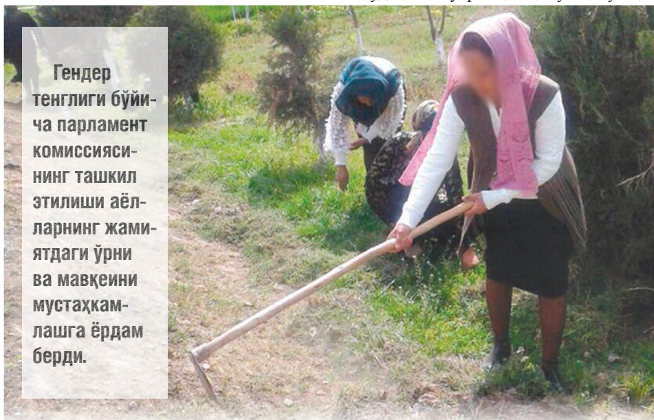
Гендер тенглиги бўйича парламент комиссиясининг ташкил этилиши аёлларнинг жамиятдаги ўрни ва мавқеини мустақамлашга ёрдам берди.

қилиш бўйича чоралар кўриш, шунингдек, Омбудсманнинг молиявий ва функционал мустақиллигини, шу жумладан, Котибият ва Омбудсманнинг минтакавий вакиллари учун қўшимча ресурслар ажратиш йўли билан мустақамлаш зарур. Гендер тенглиги ва аёлларнинг ҳуқуқларини таъминлаш юзасидан оиладаги зўравонлик учун жиноий жавобгарликни кучайтириш масаласини кўриб чиқиш лозим. Сўз эркинлигининг асосларини такомиллаштириш мақсадида оммавий ахборот воситалари фаолиятига ноқонуний аралаштириш ҳолатларига эътибор қаратиш ва уларни янада бартараф этишга қаратилган чораларини ишлаб чиқиш керак. Маълумки, яқинда Ўзбекистонда «Ногиронлар ҳуқуқлари тўғрисида»ги янги Қонун кучга кирди ва яқин келажакда Ўзбекистон Парламенти БМТнинг Ногиронлар ҳуқуқлари тўғрисидаги конвенциясини ратификация қилади. Мамлакат, шунингдек, Болалар омбудсмани тўғрисида қонун қабул қи-