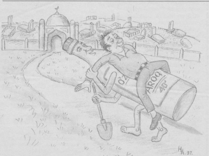
Сўзсиз сурат. Абдурасул Ҳақимов чизган расм.