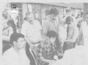
худудий ярмарка «Уриқзор» маҳалласида апрель ойининг охирида ўтказилганди.