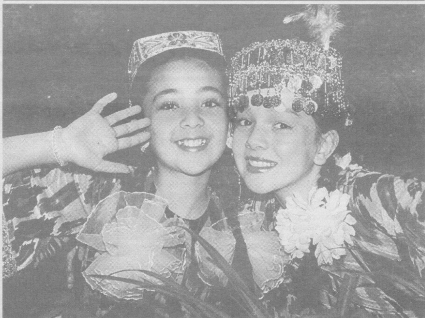
Дилдан қувнаб яйраймиз, Ватан мадҳин қуйлаймиз.