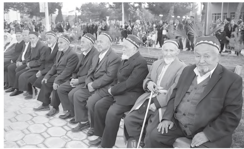
камтишларга қарши туришимиз керак".

Ўзбекистонда туғилиш кўрсаткичининг нисбатан баландлигига қарамай, аҳолининг 10