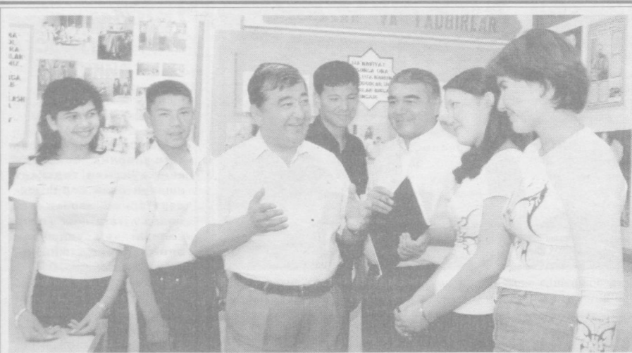
Ёшлар — келажакимиз