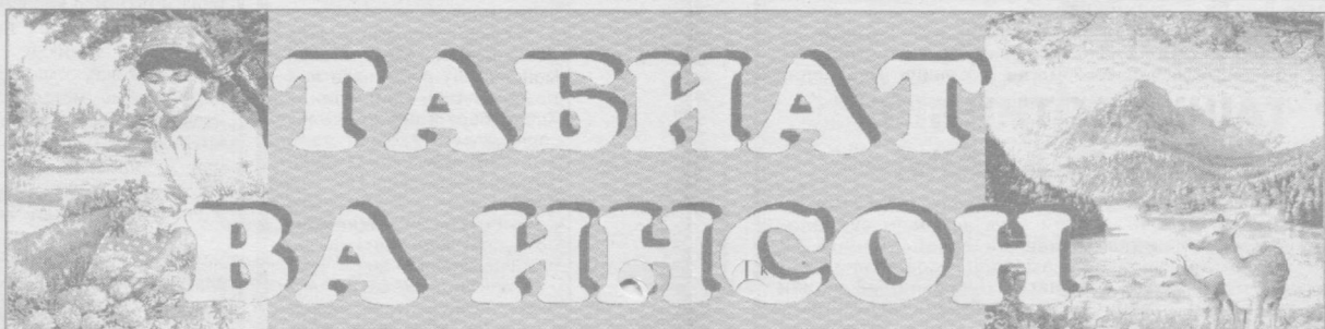
№ 6 (146) Тошкент шаҳар табииати муҳофаза қилиш кўмитасининг саҳифаси

А.АБДУЖАЛИЛОВА, кўмита ўсимликлар ва ҳайвонот дўнбеси бўлими бошлиғи