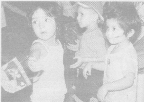
Ёз — қўтмоқда соғ

Сариқ йўнғичка уни ва кунжут билан аралаштириб тайёрланган қуюқ суртмаси подаграга ва бўғинлар оғри- ғига фойда қилади. Қайнат- маси ва уруги бошининг қас- моғига фойда қилади, карам ширасини бурунга юборил- са, мияни тозалайди. Агар баргини хомлиғича сирка билан қўшиб ейилса, талоқ касалига учраганларга фой- да қилади.