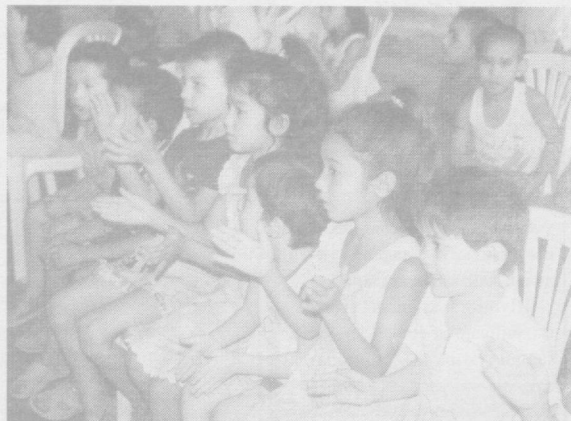
Ўз санъатлари билан йиғилганлар кўнги-ларини хушнуд этиштиди, айниқса болажонлар мириқиб шўх рақсларга тушиб маданий хордиқ чиқардилар.

Тадбир давомида иқтидорли ёш хонанда ва созандалар