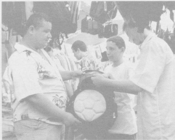
Янги ўкув йили бошланишига ҳам санокли кунлар қолди. Шаҳримизда ташкил этилган мактаб бозорлари одамлар билан гавжум. Кимдир янги кўйлак, кимдир туфли, яна кимдир, китоб-дафтарлар харид қилишга ошқмоқда. Албатта мактаб бозорларидан ўзингизга маъқул бўлган арзон, сифатли кийимлар ва ўкув қуролларини харид қилишингиз мумкин.