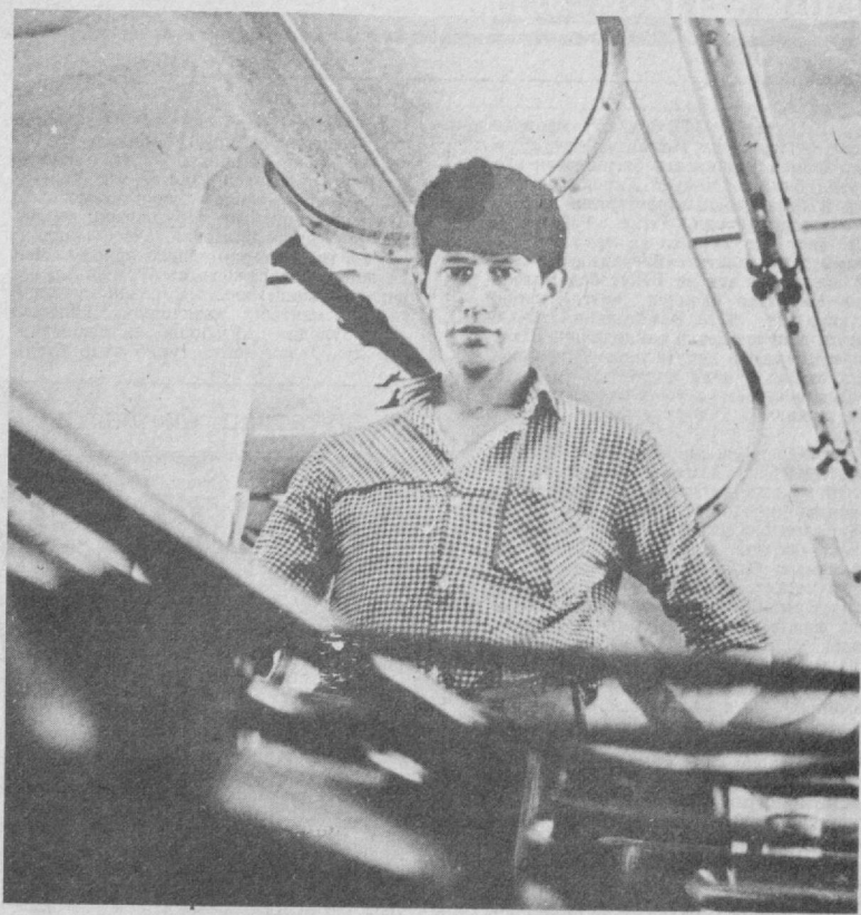
© МАТБААЧИ. «МАТБУОТ» полиграфия ишлаб чиқариш бирлашмаси 3-босмаҳонасининг илғор ишчиси Қўват Мадиев.