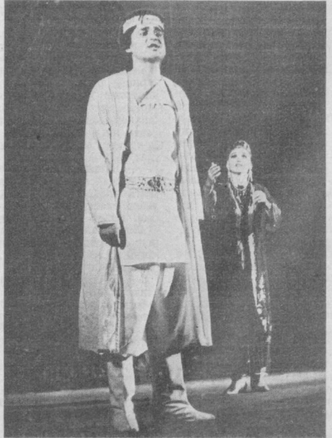
«Юсуф ва Зулайҳо»

Дарҳақиқат, драматург Рамз Бобожон жуда тил-