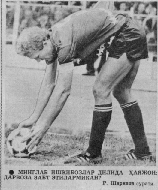
● МИНГЛАВ ИШҚИБОЗЛАР ДИЛИДА ҲАЯЖОН ДАРВОЗА ЗАВТ ЭТИЛАРМИКАН?

Масала деярли ҳал бўлган. Милла ҳатто РВДМ клуби билан шартнома тузишга келган экан, деб хабар қилди маҳаллий метбуот. Сўнг унинг яна яқин хунари чиқиб қолди.