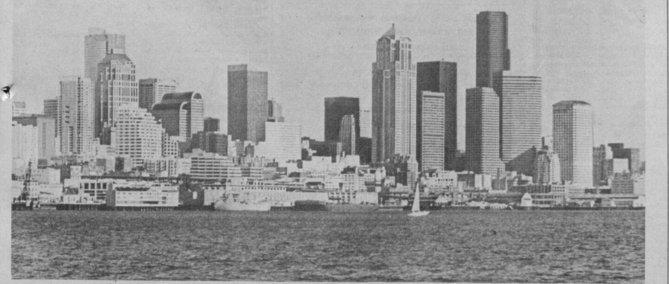
● СУРАТЛАРДА: Тошкент билан биродарлашган Сият шаҳри манзаралари. Утган йили Сиятга таширф буюрган журналист Содиқ МАҲҚАМОВНИНГ «Тошкент оқшом» рўномаси учун махсус тайёрлаган суратлари.