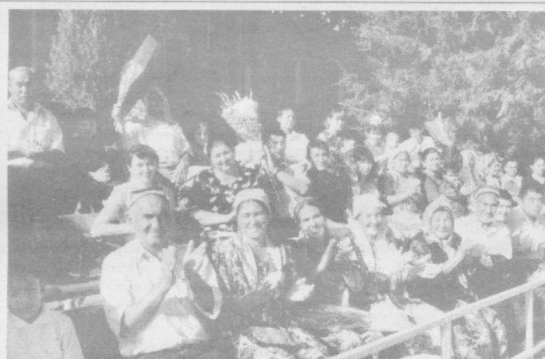
Ватанга хизмат — муқаддас бурж