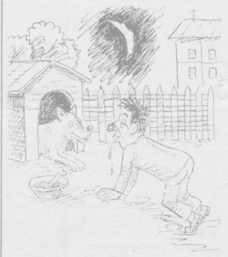
— Огайни, уйингда бир кун тунашга руҳсат берасанми?

Ласкер-ку фарзинсиз қолди, лекин коньякни ичиб, кўзлари биё-биё бўлган Мороци ўйинни ўтказиб, мукофотдан маҳрум бўлди.