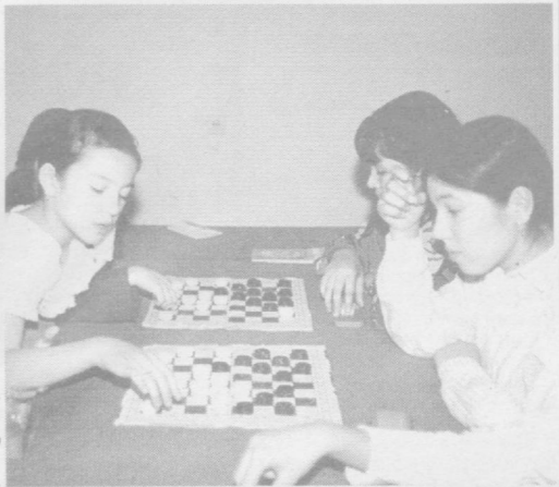
Ёшлар — юрт эгаси, келажак бунёдкоридир. Уларнинг пухта таълим олишлари, тарбияли, одоб-ахлокли, билимдон бўлиб вояга етишлари эса эртамизнинг нури кўни қафолатидир. Сиз суратда кўриб турган техника билан тиллашиб, аклни пешлаб, спорт билан ошно бўлаётган ёшлар ҳам эртага юртимиз байроғини баланд кўтарадиган ғолиблар қаторидан ўрин олса ажаб эмас.