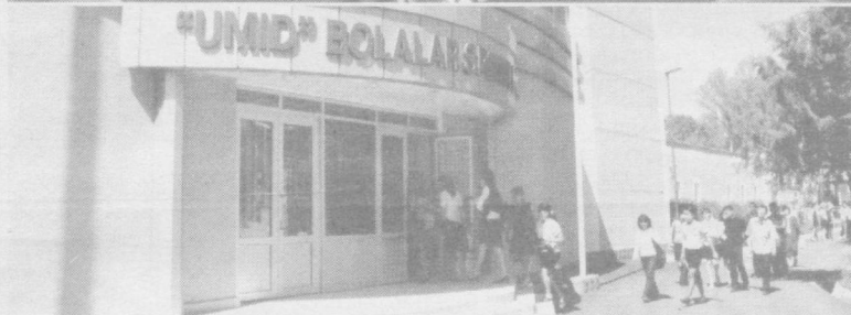
Шаҳримизда қад ростлаган спорт иншоотлари ёшларимизнинг соғлом ва маънан етук инсон бўлиб шаклланишларига хизмат қилиши шубҳасиз.