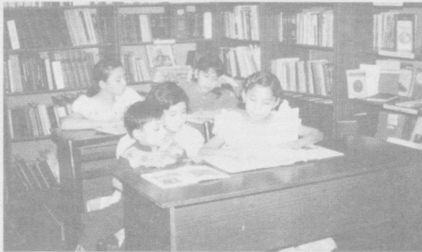
Оз-оз ўрганиб, доно бўламиз