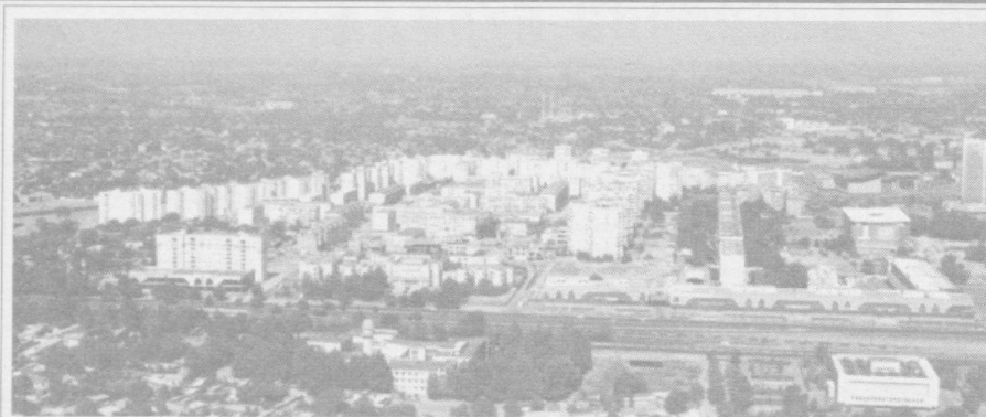
Шаҳримиз тарихини ўрганамиз