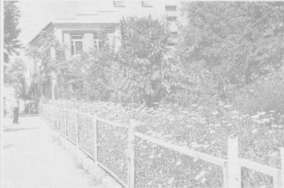
Шахримизнинг кўркем кўчалари.

мандчиликка оид нодир маълумотлар тўплаш имконини берди. Айни пайтда соҳада илмий тадқиқотларни кенгайтириш, таҳлил қилиш, чоп этиш ва халқимиз, айниқса ёшларни улاردан кенг баҳраманд этиш борасида ҳали ўз ечимини қутаётган муаммолар ҳам оз эмас.