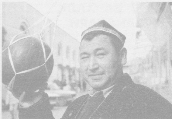
Сахий кузнинг ширин-шакар меваларидан баҳраманд бўлинг, азизлар!