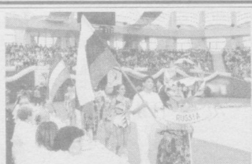
Ўзбекистон Болалар спортини ривожлантириш жамғармаси ташкил этилди.

Буларнинг ҳаммаси — мамлакатимизда спортни ривожлантиришга берилётган улкан эътибор, ёш авлоднинг жисмоний ва маънавий соғлом тарбиялашга қаратилган давлат сиёсати самарасидир. Президент Ислом Каримов ташаббуси билан мамлакатимизда болалар ва ўсмирларнинг жисмоний тарбия ва спортга оммавий жалб қилиш тизими ишлаб чиқилди. У мактаб ўқувчиларининг «Умид ниҳоллари», коллеж ва лицейлар ўқувчиларининг «Баркамол авлод» ҳамда талабаларнинг «Универсиада» мусобақаларини ўзида мўжассам этган. Давлатимиз раҳбарининг фармонига кўра,