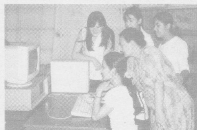
чиқариш усталари жамоаси меҳнат қилмоқда.

ли ва рақобатбардош махсус лотлар ишлаб чиқариш ҳамда уларни дунё бозорига олиб чиқиш хисобланади. Дунё бо-