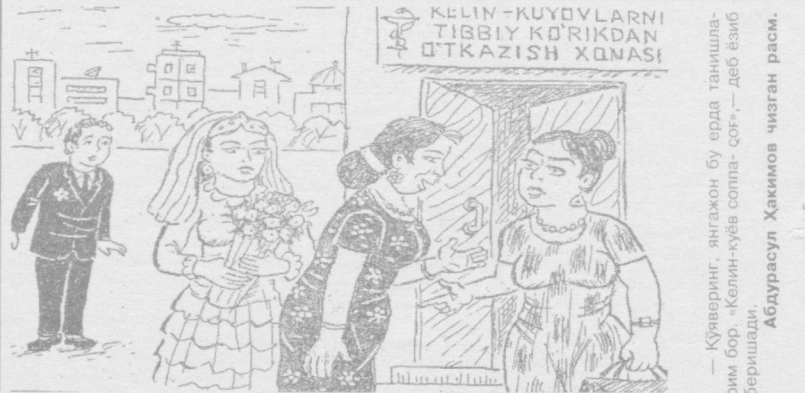
— Куйверинг, янгахон бу ерда танишларим бор. «Келин-куёв солпа-соғ», — деб ёзиб беришади. Абдурашул Ҳакимов чизган расми.

1936 йили Ноттингемдаги халқаро турнирда Решевский билан Файн учрашуви тўрт марта кечиктирилди.