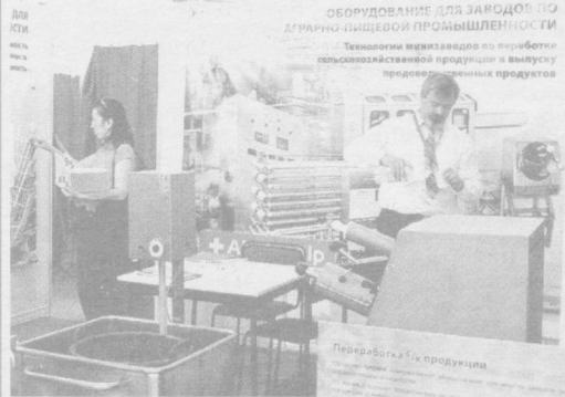
КЕЧА шахримиздаги «Ўзэкспомарказ» савдо кўргазмалар марказида «Бу — Польша» номида Польша миллий кўргазмаси очилди.