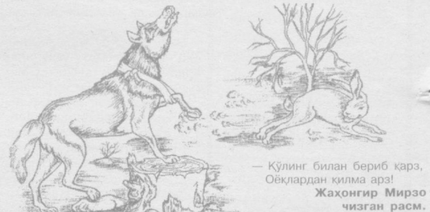
— Қўлинг билан бериб қарз, Оёқлардан қилма арз! Жаҳонгир Мирзо чизган расм.

Дилбар ЁДГОРОВА, Тошкент шаҳар ИИББ Матбуот маркази жамоатчи мухбири.