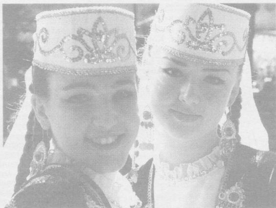
Юзларидан нур ёғилар бу кизларнинг, Коши қора, сочи сумбул санамларнинг.