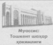
Муассис: Тошкент шаҳар ҳокимлиги