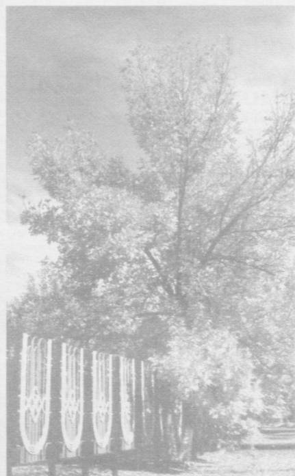
Улкамизда қуз.