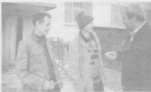
Қиш тайёргарликни ёқтиради

— Шаҳримиздаги барча уйларни қишга тайёрлашда яна қандай юмушлар адо этилди?