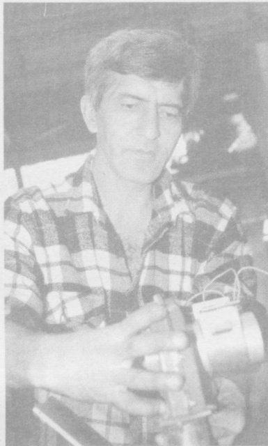
Шаҳримиздаги «Профиль» илмий-техникавий фирмаси маҳсулотлари саноат ва қишлоқ хўжалиги ривожига ниҳоятда қўл келмоқда.

Оқсаройдаги учрашувда ана шу масалалар ҳамда томонларни қизиқтирган халқаро муаммолар юзасидан фикр алмашилди.