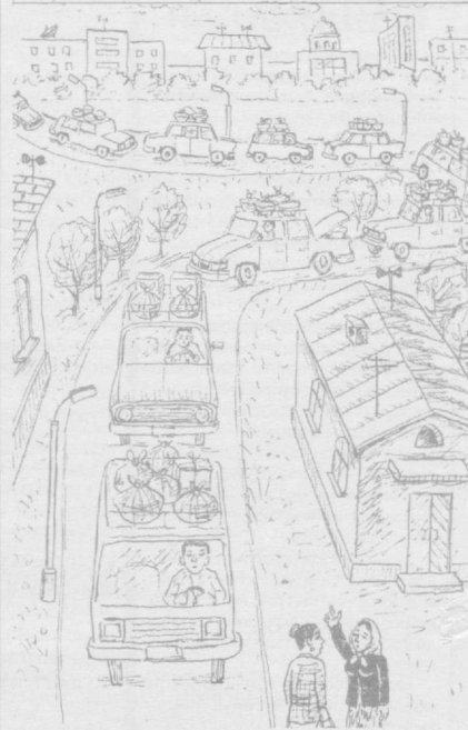
Шунақаси ҳам бўлади.

133-15-32, 139-05-57, 55-67-42, 55-19-73.