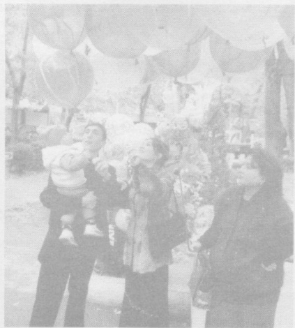
Байрам шуқуҳи давом этмоқда.