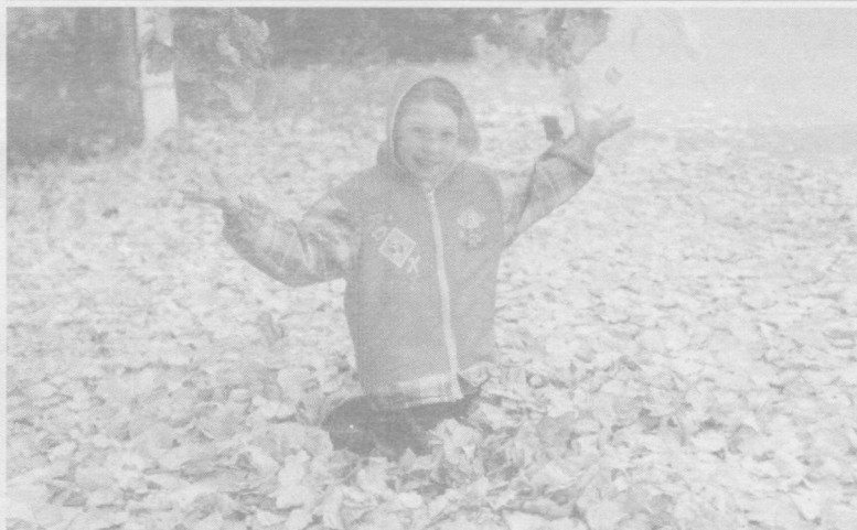
Кузнинг сеҳри ўзгача