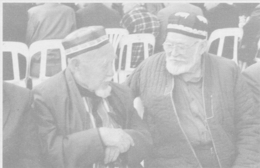
Хонадонларимизнинг кўри бўлмиш кексаларимиз доимо хурмат-эътиборда, эъзозда. Зеро, қариси бор унинг париси бор, деб бежиз айтилмаган. Сиз суратда кўриб турган отахонлар юртимизда кечаётган ижобий ўзгаришлар ҳусусида мириқиб сўхбат қуришмоқда.

Яқинда бир дугонамизни кига дарс тайёрлагани йиғилган эди. Кўшни ховлидан аёл кишининг йигиси, сўнг унинг: «Менга ҳам осон тутманг. Ёшманку ахир. Бу ахволда ўлингиз билан қандай турмуш кечираман», деган сўзлари баралла эшитилди.