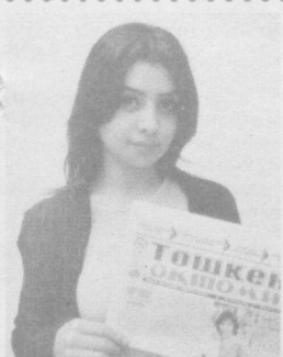
Тошкент шаҳар ҳокимлиги Матбуот хизмати ва ўз мухбирларимиз хабарларидан.

● Ироқнинг Ал Фаллужа шаҳридан жангариларнинг турли ҳажмдаги замонавий курул-ароғлар мавжуд бўлган йирик курул омбори топилди.