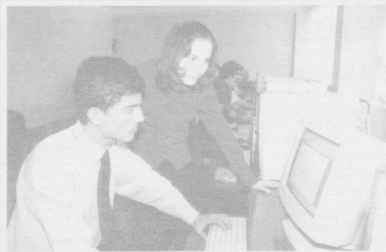
Обука — 2005

Ўз айбинг кўрмоққа юз марта кўз оч, Ўзгага бир бор ҳам кўз очишдан қоч!