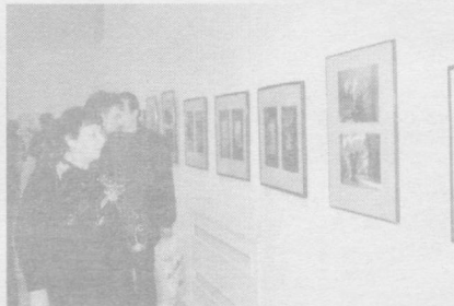
Танловда жами 775 та асарлар иштирок этаётган бўлиб, 144 та мохир фотоси, «Қандай гўзал бу олам», «Пейзаж ва архитектура», «Болаларга