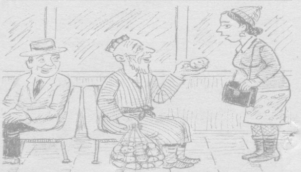
— Қизим, ҳайдовчингиз картишкаларингни кўрсатийла деди, мана картишка.

Уни тайёрлаш учун 6 та тухумнинг оқи саригидан ажрати-либ, сўнгра оқиға 2 стакан шакар аралаштирилади. Кейин тухумнинг сариги қўшилади. Аралашмага 2 стакан ун солиниб, суюқроқ масса тайёрланади. Махсус пирог пиширил-диган қолип ёки товага ёғ суртиб, пергамент қоғоз қўйиб, унинг устига нон толқони сепилади. Тозаланган олмали юпка қирқиб, тайёрлаб қўйилган идишнинг ярмигача солинади. Сўнгра устидан тайёрланган массани қўйиб, 40 дақиқа да-вомида паст оловда пиширилади. Пирог совиғач, қирқиб, дастурхонга тортилади.