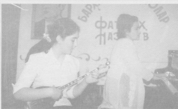
Хотира — муқаддас тўйғу