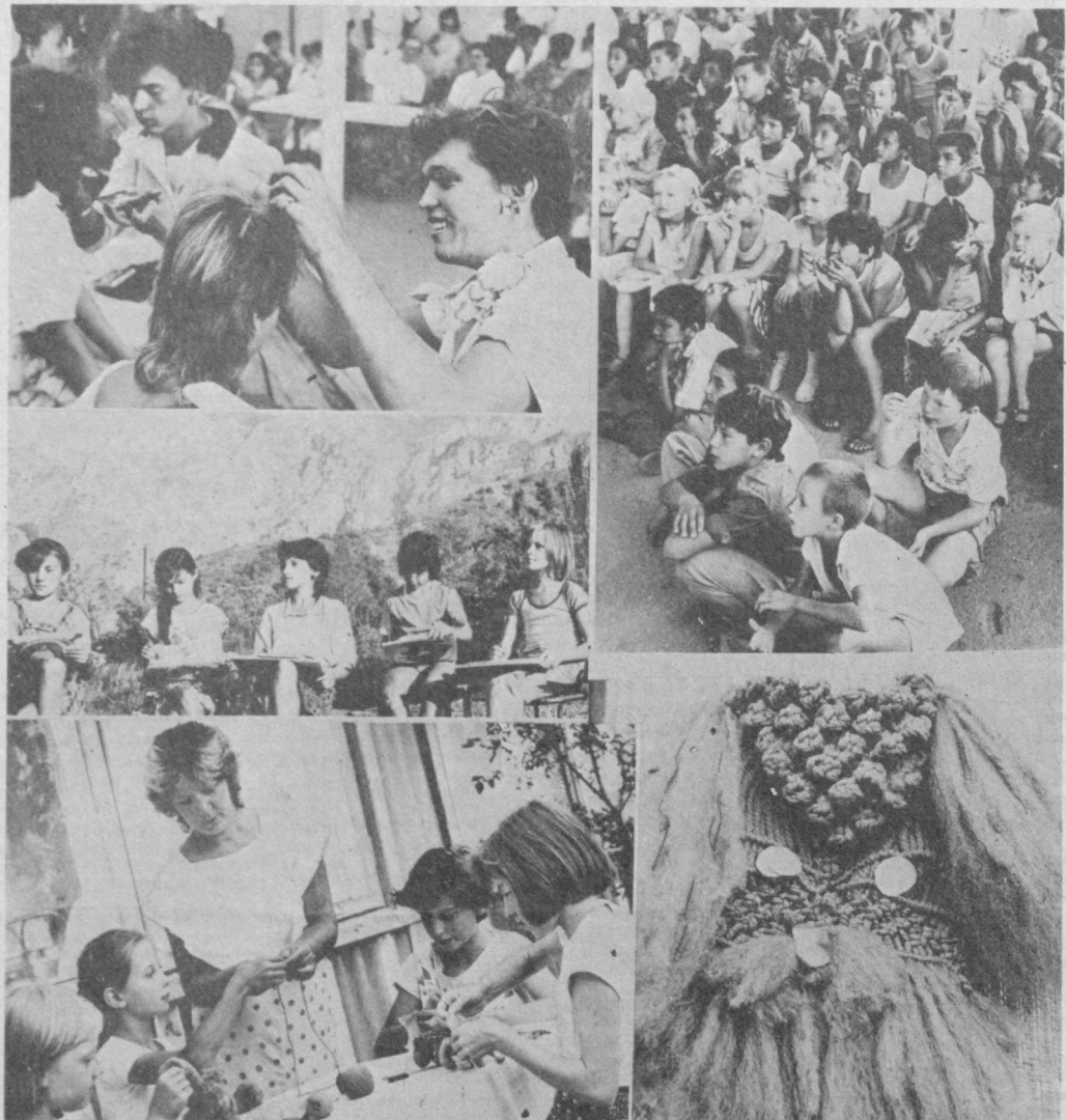
© ХУШМАНЗАРА ТОҒ ЭТАГИДА. Болаларнинг ёзги таътили кунроқ ва мароқли ўтмоқда. 153-қурилиш бошқармасининг Чимёнинг хушманзара тоғ этапларида жойлашган «Солнечный» кашпофлар лагерида дам олаётганлар ҳам мириқиб хордиқ чиқаришляти: тўғарақларда хунар ўрганишляти, танловларда қатнашишляти. СУРАТЛАРДА: лагерь ҳаётиндан лавҳалар. Х. Шодиев суратлари.