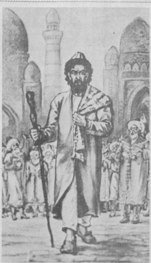
Халойиқлар мени қувлар «ёмон деб ҳар шаҳар бормас. Ажаб мардуд, ажаб мажазуб, ажаб ҳайрона Машрабман.

— Шоир асарлари ўз даврида девон ҳолига келтирилганми? Умуман унинг ҳаёти ва ижодидан маълумот берувчи асарлар борми? — На ўзи, на замонадошлари томонидан алоҳида девон ҳолига келтирилгани маълум эмас. Унинг ашъорини бизга шоирнинг содда шогирди Пирмат Сеторий томонидан халқ китоблари услубида битилган «Китоби ошнинг Машраби Мажазубий валдулоҳ» асаридан маълум. Пирмат Сеторий ана шу китобга устозининг кўпгина сара шеърларини киритган. Бундан ташқари ўша замонда тузилган бир қанча баёзларда ҳам Машраб шеърлари учрайди. Бироқ шоирнинг ҳаёти ҳақида аниқ тасаввур берувчи тарихий манба сўнгги вақтларгача маълум эмасди. Айрим узуқ-юзуқ хабарлар бир-икки таъзирада учрарди, хоҳос. Мен эллигинчи йиллар охирида Хўжаевда ишлаган вақтимда Машрабга замонадош бўлган Зо бир — Қаландарнинг авлодла-