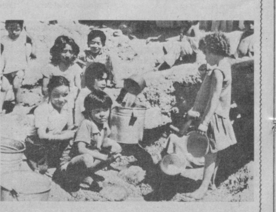
© Иносийят қанчадан-қанча касалликларни енгди. Минглаб одамларнинг ёстиғини қуритган чекан. Ҳат касалликларни ўтмишда қолди. XXI асрда полиомеелет уларнинг қаторига қўшилди. Мутахассислар ўз олдларига ана шундай вазифани қўйишган. Жаҳон соғлиқни сақлаш ташкилоти маълумотларига қараганда, полиомеелет касаллиги билан ҳозир бутун дунёда қарийб 40 миллион бола хасталган. Ана шу касалликни келтириб чиқарувчи асосий сабаблардан бири — бу иктымол базанни бўлишдир. СУРАТДА: полиомеелет касаллигининг тарқалиши учун энг қудай шаронт ифлос сув ва ахлатлардир. Камера Пресс — ТАСС сурати.

вий ишларининг аҳволига салбий баҳо берди. Шу йилнинг январь ойида атғи 52,7 фоиз салбий баҳо берган эди. Майда ва ўрта Америка қорчалонлари орасида «умидбахшлик индекси» пасайиб кетаётганлиги ҳам Синдлингернинг фикрини тасдиқламоқда. ТОКИО. Япониянинг Эн-Эйч-Кей марказий радио-эшитириш корпорациясининг Токиодаги манзили хонаки ёндирувчи қуроллар билан ўққа тутилди, деб хабар қилди Токио полиция бошқармаси вакили. Полициячининг гапларига қараганда, бир неча куйган ана шундай «снаряж» буюнини томидан ва бино яқинидаги автомобил бекатидан топилди. Бино яқинидаги бодан эса кейинчалик уй шаронлида тайёрланган отиш қурмиласи топилди. Ўққа тутиш учун мастулиятни ҳозирча террорчи ташкилотлардан биронтаси ҳам зиммасига олмади, лекин маъмурият бу ишга ўзга сўл экспертлар «император оиласини ҳимоя қилувчи газетали репортёрларга қарши норозилик белгиси сифатида ташкил этганлар», деб шубҳаланмоқдалар.