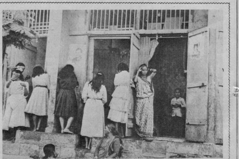
Бомбей Ҳиндистоннинг ҳамма эътибор этган маданий марказини бундан бундан қадар, мамлакатнинг иқтисодий иллатлари аққол кўзга ташланган туррувчи шаҳри ҳақ ҳисобланади. Ушбу сурат Бомбейнинг «Қизил фонсулар қўчаси»да олинган. Бу кўча деярли гўла-тўқис арзон баҳони ишратхоналардан ташқил топган. Панжаралар ўрнати-

ПХЕНЬЯН. Пханмунжонда Кореяда яраштириш ҳарбий комиссиясининг навабдаги мажлиси бўлди. У Корея ярим оролида сўнги ҳафталарда юзага келган аҳволни муҳокама қилишга бағишланган эди. Мажлис Ши-