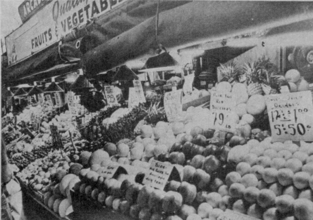
● СУРАТЛАРДА: Тошкент билан биродарлашган Сизга шаҳри манзаралари.