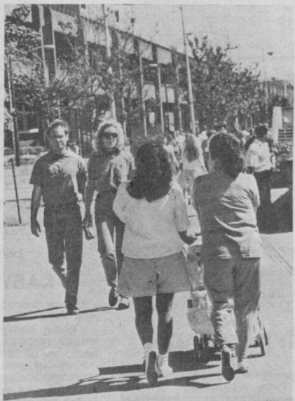
Шунчалик довруқ солганликлари бежиз эмас экан.

Георгий Вячеславович компанияда ишнинг ташкил этилиши билан батафсил таъиноти-на қолмасдан, америкалик ҳамкасбларнинг турт уринли спорт тайёрасида «Бонинг»га тегишли улкан ҳудуд устидан учиб ўтиш имкониятига ҳам эга бўлди. Бу ўринда яқин вақтга Сизга худди бизнинг Горькийдагидек ёпиқ шаҳар бўлганлигини эсламай бўлмайди. Буни эҳтиом америкача ошқоралик деса бўлади.