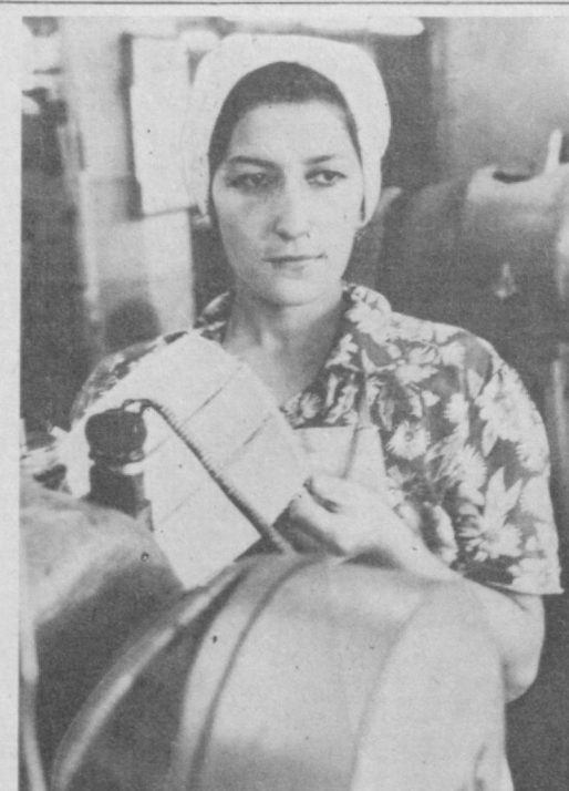
«ОРЗУ» чарм-атторлик ва спорт буюмлари ишлаб чиқариш бirlашмаси маҳсулотлари аҳоли дидига мос қилиб таъинлаш тўғрисидаги қарор қабул қилинди.

Келаси йили жумҳурият қорхоналарида ва ундан ташқарида сигнал қўриқлари ва ускуналарни таъйинлаш учун буюртма бериш кўзда тутилган. Бу ҳар йили фуқароларнинг камида юз миң хонадонини марказ