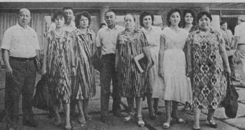
СУРАТЛАРДА: шаҳар халқ таълими ходимларининг август кенгашида.