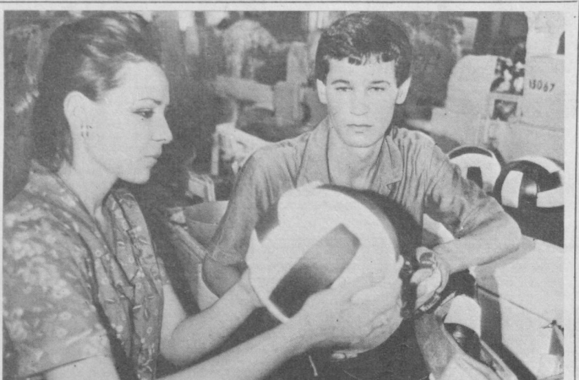
Истеъмол буюмлари кўпаймоқда

Ютуқларга эришишнинг яна бир йўли ҳар ой якунига қўра цех жамоалари меҳнатда-